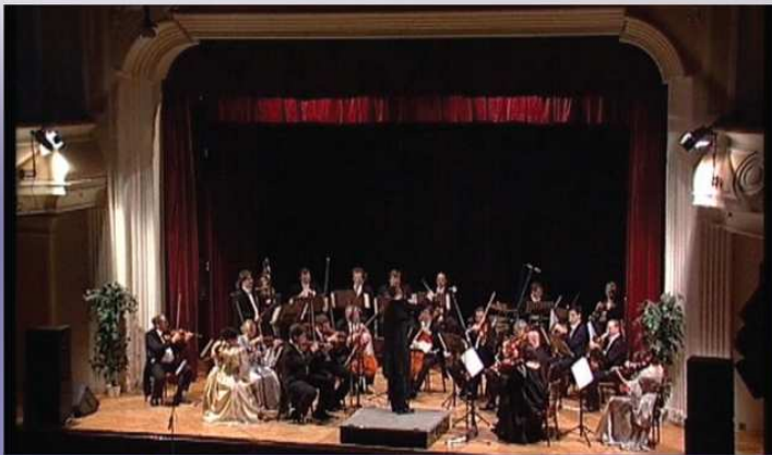
Operetní Galakonzert, Praha