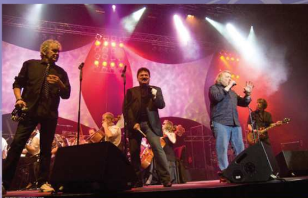
Rock meets Classic 2010