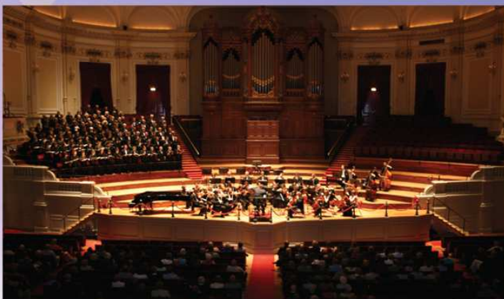
Concertgebouw - Amsterdam