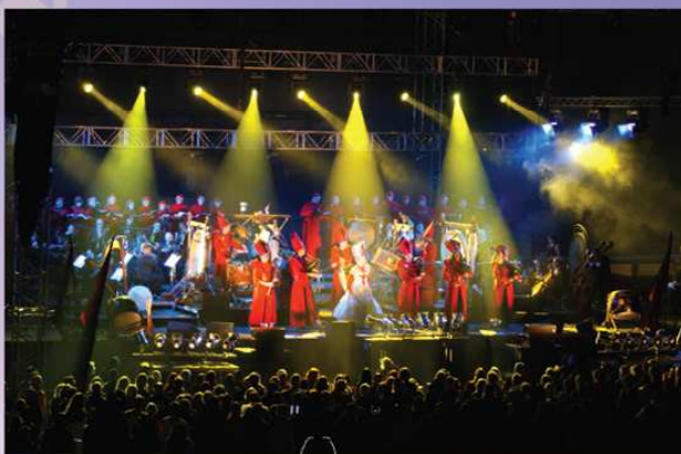
Cantus Buranus II