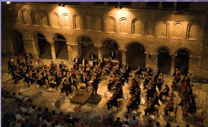
Ohrid - Makedonie